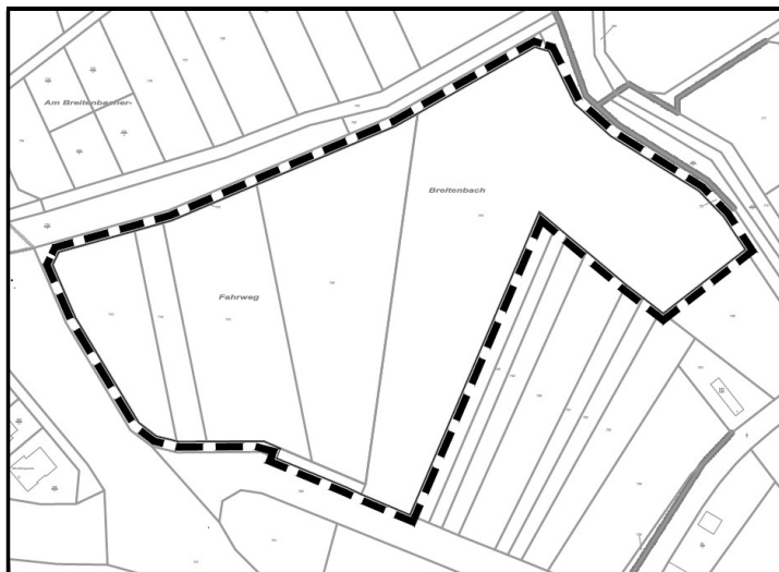
Abbildung 2 Auszug aus der Liegenschaftskarte mit Eintragung des räumlichen Geltungsbereiches der teilbereichsbezogenen Änderung des FNP